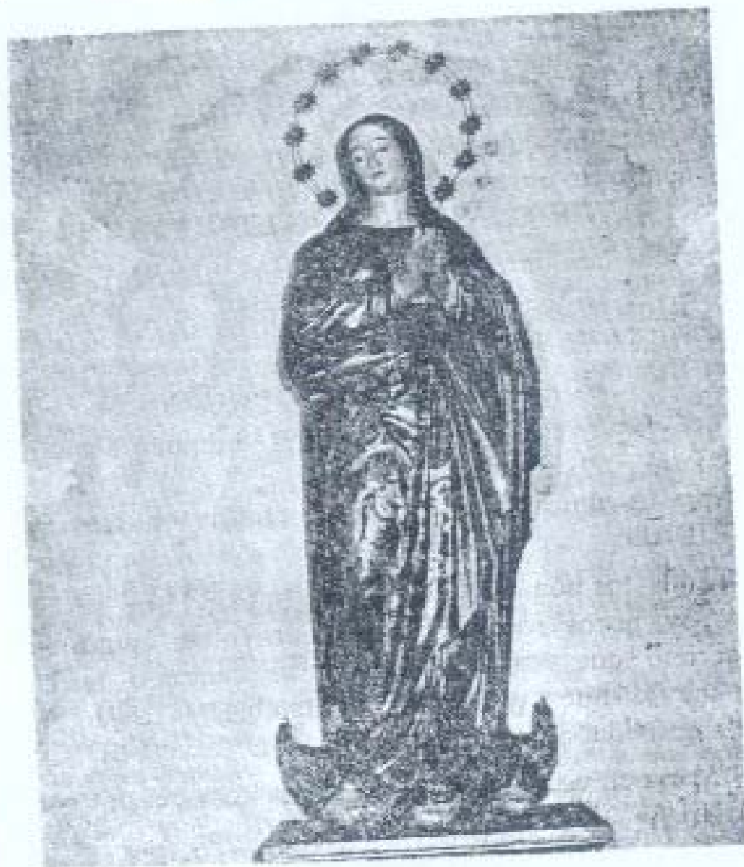
Imagen de la Inmaculada Concepción, Titular de la Parroquia y de la Hermandad.